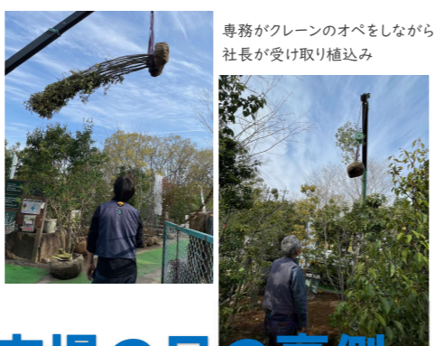
専務がクレーンのオペをしながら社長が受け取り植込み