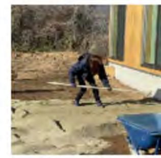
外野突っ込み「おまえでいいぞ!」

仕事を手伝う、(増やす?)ひとみちゃん。今回は現場で「私もやりたい!!」と必死にやっていたのですが「社長、ここ平らにするんですよ!」