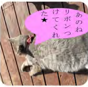
あのねリボンつけてくれた★

まだまだ寒いですが確実に春が近づいています。社長は先日フキノトウを山採ってきた。3月は溪流釣りの解禁で、スタッフも一緒にいくぞうう少すとタラの芽、わらび、ふぎ、たけのこと並走して畑もやったり、今年も社長はフルパワーで走り回ることでしょう。山菜、野菜はいくつかおにんに販売していただきますのでぜひお立ち寄り頂きたい。春の味覚を味わってください。テキストテキストテキストテキストテキストテキストテキストテキスト