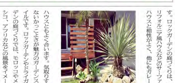
ロックガーデンの庭づくりは、カリフォルニア風ハウスなどのサファールハウスと相性がよく、他にもカラーシ

今月はLINE登録者限定のイベントです。株立ちの需要が多い中で、単木の素晴らしいものを提案します。シンボルツリーの他に、アプローチなどにさりげなく1本木があると風情が増し何とも言えない良さがあります。少し斜めに植えたりするとお洒落でやわらかい感じになります。セカンドツリーとしてお勧めいたします。数量限定ですので無くなり次第終了となります。ひよろつとしていますが樹高は4m越えのものもあり存在感はたっぷり。お庭の雰囲気を変えてみてはいかがでしょうか?