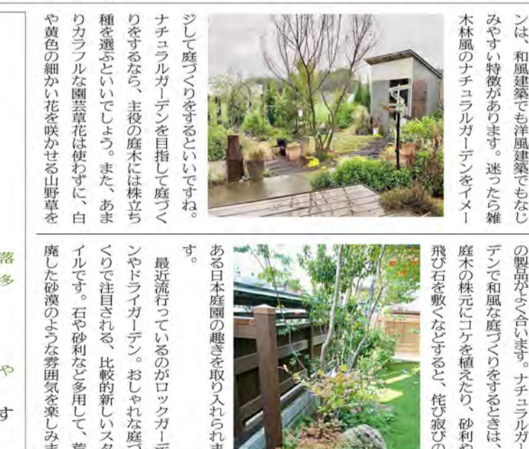
ある日本庭園の趣きを取り入れられま

紅葉樹と常緑樹 どっちがいい? 紅葉樹のメリット: ・芽吹きから落葉まで、移りゆく季節を体感できる ・花が美しく楽しめる種類が多い/紅葉が美しい ・足元の下草が育つので自然さを演出できる 紅葉樹のデメリット: ・冬の彩りが失われる/葉が落ちるので掃除が大変 ・夏の暑さ乾燥に弱い種類が多い 常緑樹のメリット: ・常に葉があるので目隠しとして最適/葉を一度に落とさないで掃除が楽/暑さ・乾燥に強い植物が多い/生長が比較的ゆっくり 常緑樹のデメリット: ・葉の色が濃く厚みもあるため重い印象/ ・下草に日があたらないため下草が育ちにくい/やや寒さに弱い これには正解はなく、状況により判断する必要があります(次月へ続く)