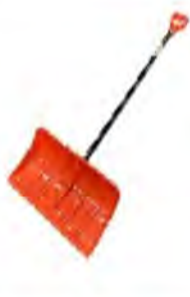
雪かきの道具 皆さんのいつものお持ちですか?雪かきで使える道具は一つだけ。ずばりラッセル型(写真)これ以外が低く負担も大きいです。ただし壊れることを予想して2機あるとよいそうです。